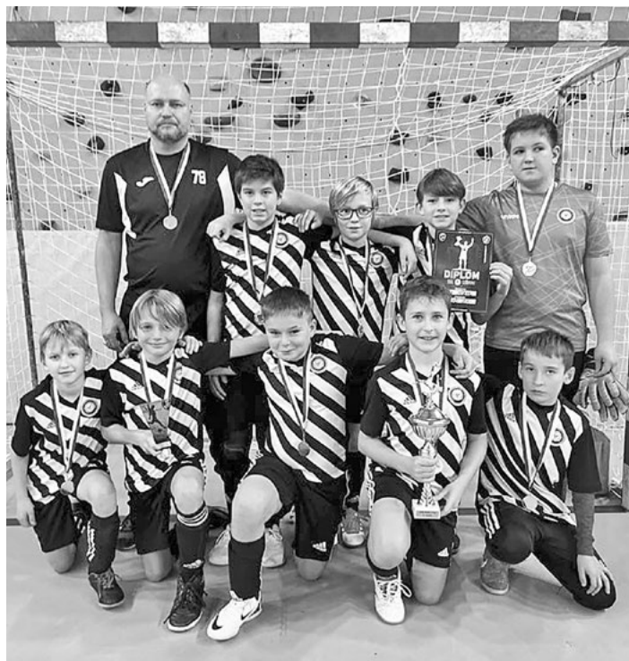
Tým Mšena na mělnickém turnaji vybojoval 3. místo.

J. Holuška, M. Oppitz, T. Procházka, M. Vaněk a F. Ščastka po vítězstvích nad FK Sahara Vědomice, FK Viktoria Všetaty, AFK Hořín/Cítov, prohře s TJ Sokol Tišice a remízou s FK Mělník 1901 (zde nám na první místo stačilo vstře-