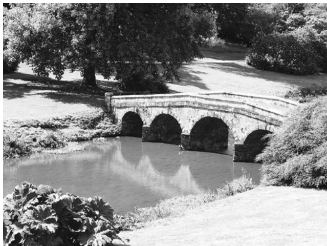
Palladiovský most měl předlohu v italském města Vicenza.