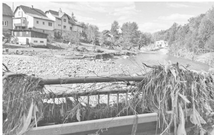
Tři mšenští dobrovolní hasiči pomáhali s likvidací škod po zářijových povodních v Mikulovicích na Jesenicku.