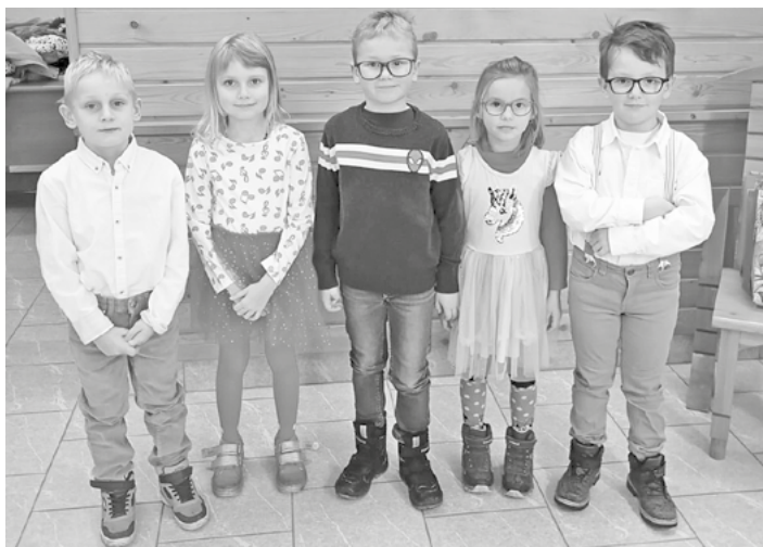
Děti si přichystaly vystoupení pro malé občánky.

Zážitky v naší školce pokračovaly i v listopadu. Šestáho listopadu k nám zavítalo divadelní představení Kocour v botách. Děti byly nadšené - se zájmem sledovaly děj, zpívaly písničky a nechaly se vtáhnout do pohádkového příběhu. Krásné kostýmy, chytlavé melodie a důležitá ponaučení vytvořily