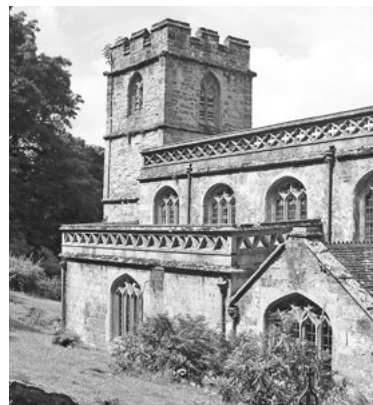
Původní gotický kostel sv. Petra.

Projdeme prostornou jeskyní Grotto, ta poskytuje návštěvníkům při velkých vedrech příjemné ochlazení. Ve výklenku spí u studené lázně napájené odbočkou místního potoka krásná nymfa, nikoli živá, ale zhotovená z bílého mramoru. Společnost jí dělá bronzová socha říčního boha u východu z jeskyně. Ten nám rukou ukazuje, jakým směrem se máme dále pohybovat. Dáme na něj a pokračujeme po kamenné hrázi kolem jezera. Pod cestou vidíme další jezero, pod hrází je průnik a voda z horního jezera ho napájí. I tady se všude pohybuje řada vodních ptáků, občas i některý plave na vodě. Ostatní se vyvalují na cestě, že by před námi o kousek ustoupili, je nenapadne,