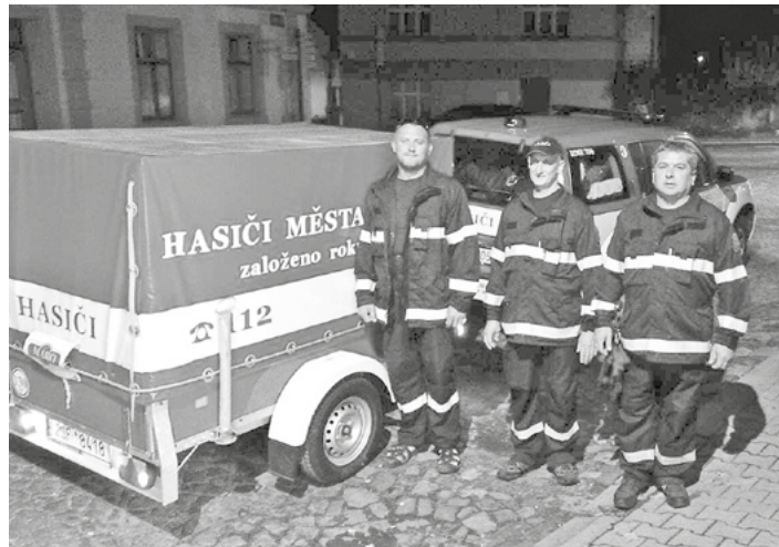
Všichni tři už měli zkušenosti z povodní z minulých let.

Je skvělé, že naši hasiči za každé situace plní své poslání a pomáhají tam, kde je potřeba. My si jejich