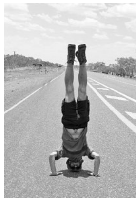
Součástí přednášky bude promítání fotografií.