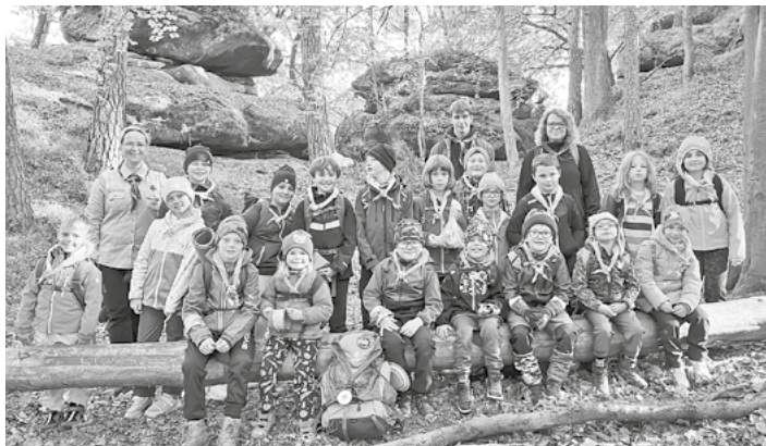
Nedílnou součástí skautingu jsou výlety do přírody.

Já sama jsem poslední tři roky vedla nejmenší děti ve skautském vodáckém oddíle v Mladé Boleslavi, nicméně mým přáním bylo sk-