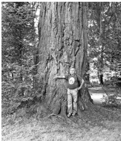
Mohutná sekvoj z osmnáctého století.