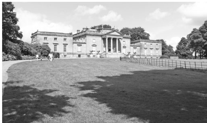
Vila Stourhead House byla zařízena jako zámek.

Hned u parkoviště stojí řada velkých budov a skleníků, ve stáncích prodávají sazenice všech druhů ze zdejší produkce. Návštěvnické centrum nabízí i řadu publikací a suvenýrů. Zaplatíme rozumné vstupné a jdeme do areálu. Máme podrobný plánec i s popisem jednotlivých míst. V dolní části ohraničuje komplexe kamenná zeď, branou se dvěma postranními věžemi vcházíme dovnitř a stoupáme širokou cestou kolem rozlehlé vily do horních zahrad. Vila Stourhead House zařízená jako zámek s apartmány, salonem, knihovnou a řadou obytných místností sloužila jako sídlo tehdejšího panstva. Dnes je v ní sbírka uměleckých předmětů, tam nepůjdeme, raději si užijeme pořádně park. Ten tvoří jakési arboretum dřevin z velké části světa. Jdeme alejí jedlých kaštanovníků, prý tu stojí asi 400 let. Jsou to obrovské kolosy a vypadají zdravě. O kus dál si připadám jako v severní Americe,