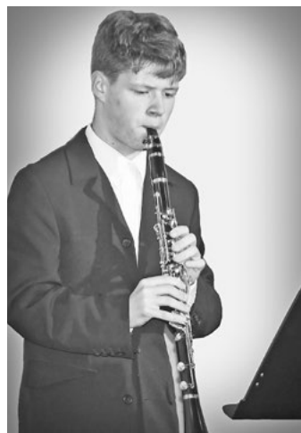
Nechyběly ani žestové nástroje...