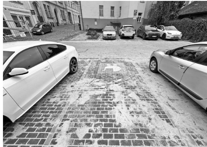
Na opraveném parkovišti je celkem devět parkovacích míst.

Bohužel součástí parkoviště je také pískovcová zídka a ta se ukázala jako velký problém. Fir-