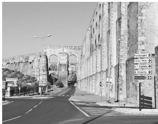
Akvadukt Aqueduto da Amoreira.

Začínáme polévkou, potom dostáváme plný talíř grilovaného masa z více různých zvířat, kořeněnou omáčku a těstoviny podobné špagetám. K tomu misku zeleninového salátu a jako pozornost podniků litrový džbán výborného červeného vína pro šest osob. Tomu tady říkají viñu tintu. Ale píšou to bez háčku, oni totiž hrozně šišljají, s tím jsme se setkávali všude v zemi. Ještě se zmíním o portugalských polévkách, všechny mají stejný základ z vařených a rozmixovaných brambor. Do toho přidají silný vývar z různých druhů zeleniny, koření a jsou trochu cítit česnekem. Podle přidané zeleniny má pak výslednou barvu. Naše je světle zelená, protože obsahuje nasekanou kapustu a také kostičky mrkve. Těla máme dost zničená tou dlouhou cestou, jdeme hned na lože, máme spánkový