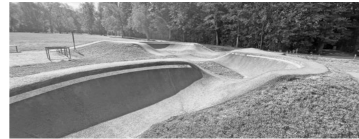
Hlasovat je možné například pro pumptrackovou dráhu.

Anketa je vytvořena v aplikaci MUNIPOLIS – Mobilní rozhlas. Hlasovat v anketě ale může úplně každý, i ten, kdo aplikaci v telefonu nemá. Jedinou podmínkou je, uvést na konci ankety telefonní číslo, na které vám přijde autorizační kód pro potvrzení hlasování. Tím je zamezeno opakovanému hlasování z jednoho telefonního čísla.