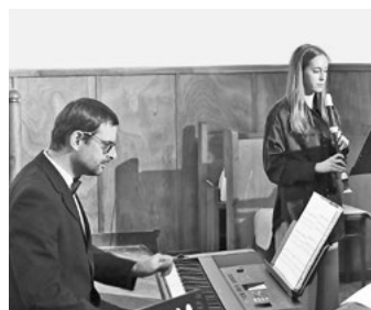
Část programu patřila ZUŠ Mšeno.