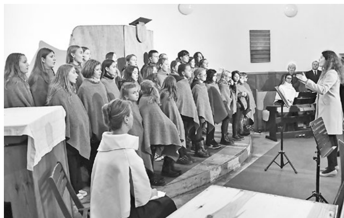
Divákům se představili i mladí pěvci z mělnické ZUŠ.