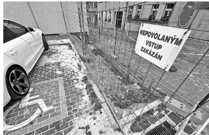
S dokončením se čeká na dodávku atypických pískovcových kvádrů.