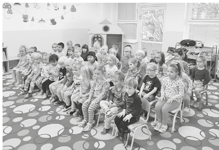
V polovině září do mšenské školky zavítalo hudební divadlo.