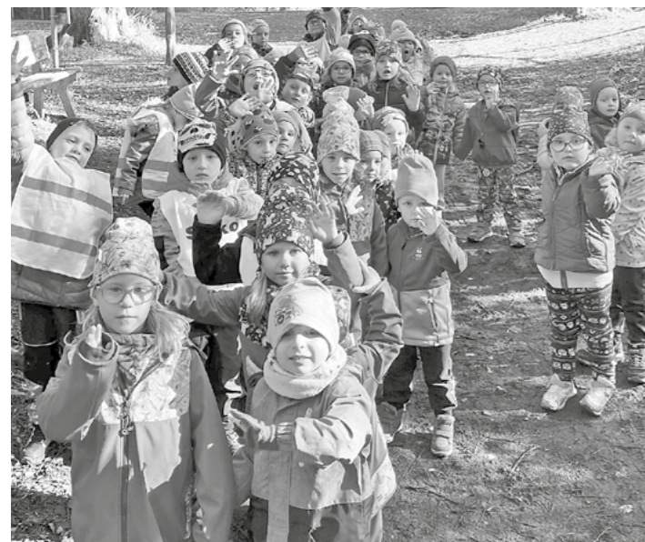
Děti ze mšenské školky rády vyrážejí do přírody.