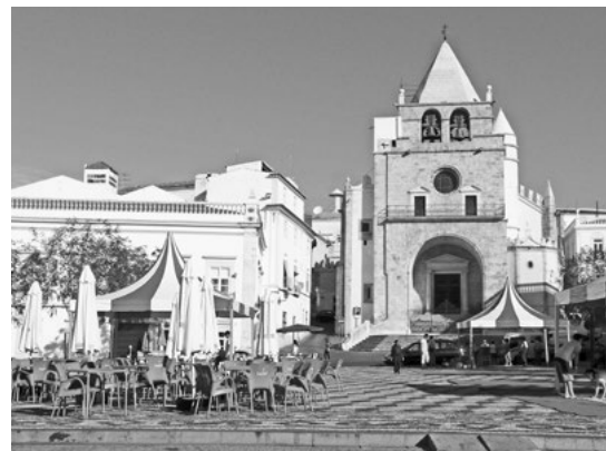
Kostel Nossa Senhora byl bohužel zrovna zavřený.

Kolem nejstaršího kostela Nossa Senhora se dostáváme na náměstí Praca República. Kostel je ovšem zavřený, tak si pořádně projdeme