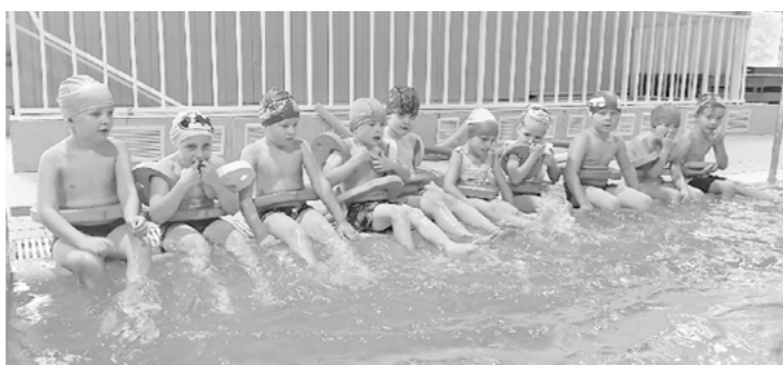
Na konci září začaly děti navštěvovat mělnický plavecký bazén.

Konec září odstartoval pro předškoláky důležitou etapu – kurz plavání. Během deseti lekcí v mělnickém bazénu se děti pod vedením zkušených instruktorek seznámily